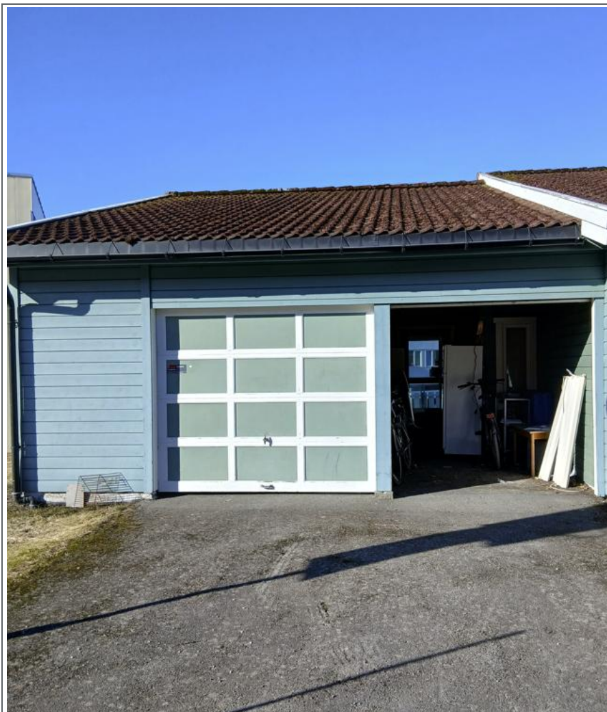
Tabell 1: Bygningsinformasjon.